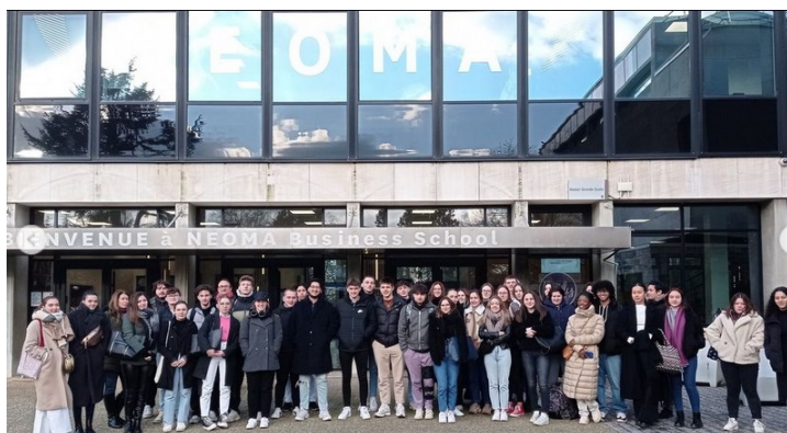
Visite de NEOMA Rouen (2023)

Spécificité de la classe préparatoire : un accompagnement personnalisé grâce au système de « colles ». Ces séances d'entraînement, dispensées par des professeurs de la classe préparatoire, de lycée, de BTS ou d'université, s'effectuent individuellement ou par groupe de trois étudiants.