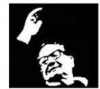
Lycée Salvador Allende HEROUVILLE ST CLAIR